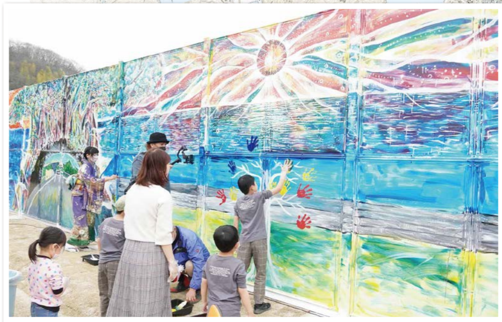
セレモニー参加者による ハンドツリー作成の様子 (@呉ポートピアパーク)