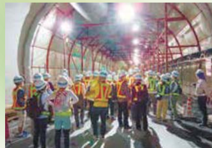
トンネルを見学するバスツアーの参加者ら —国見山トンネル—

普段は見る事ができない現場に潜入するバスツアー『おとなが楽しむ社会見学』が、昨年11月7日、播磨自動車道 国見山トンネル(裏面参照)(2,709m)でありました(参加者42名)。同ツアーは、兵庫県企業庁により、播磨科学公園都市のまちびらき20周年を記念して企画されたもので、播磨科学公園都市にあるSPring-8/SACLAも合わせて見学しました。 トンネル工事見学では、工事中のトンネル内をウォーキングし、コンクリートを吹き付けて壁を補強する作業などを見学しました。