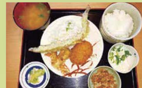
銀の馬車道 定食 穴子1尾の天麩羅、但馬鶏の唐揚げ、桃色吐息コロッケ、自家製鶏飯の具、自家製豆腐、漬物、みそ汁、ご飯つき。とてもお得な内容です。

平成29年11月25日、すすきで有名な砥峰高原がある神河町で、国道312号沿いに、中播磨地域で初めての道の駅「銀の馬車道・神河」がオープンしました。 こちらのおすすめは、「銀の馬車道 定食」。 ぜひお立ち寄りのうえ、ご賞味下さい。美味しいですよ!