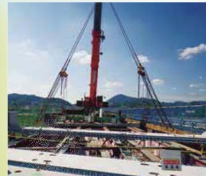
(床版取替工事 施工中)

昨秋、中国自動車道 福崎IC～山崎IC間 市川橋下り線において、床版取替工事を実施しました。引き続き、今春にも市川橋上り線の床版取替工事を予定しています。ご迷惑をおかけしますが、ご理解ご協力をお願いいたします。