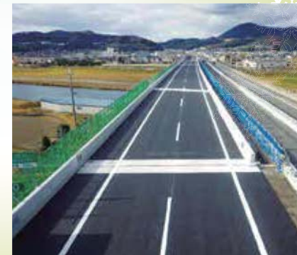
(床版取替工事 完了)