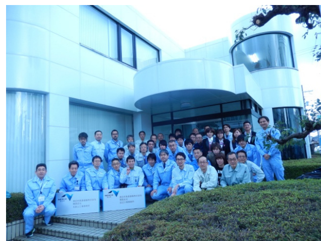
新事務所前にて集合写真