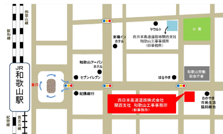
JR和歌山駅「東口」より徒歩6分