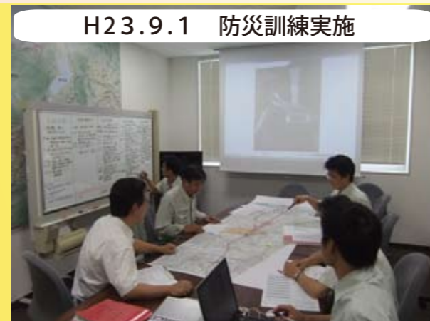
H23.9.1 防災訓練実施 9月1日「防災の日」に新名神高速道路沿線での地震による災害を想定した防災訓練を実施しました。もしもの時の避難場所は把握していますか？ 訓練では防災マップを基に自宅からの避難場所の確認も行いました。