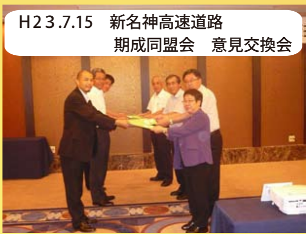
H23.7.15 新名神高速道路 期成同盟会 意見交換会 兵庫県、神戸市、宝塚市、猪名川町、川西市の各首長と国土交通省、NEXCO が一堂に会して、新名神高速道路（兵庫県）建設促進に係る意見交換を行いました。各関係機関で協力し早期開通を目指して頑張ります。