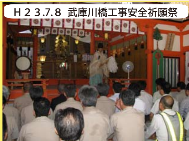
H23.7.8 武庫川橋工事安全祈願祭 道場町の塩田八幡宮において、地元自治会、関係行政機関の方々にご出席頂き、工事安全祈願祭をとり行いました。関係者一同、無事故・無災害で工事を完成できるように祈願しました。