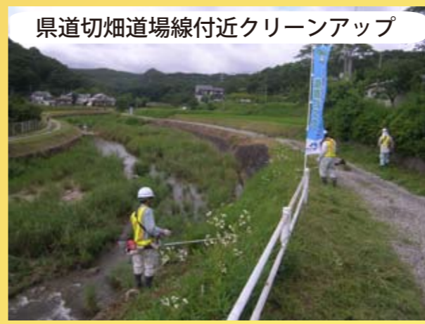
H23.6.26 生野地区において自治会草刈り作業に参加しました。また、H23.9.10 県道切畑道場線沿道のクリーンアップ（空き缶拾い）を実施し、現場周辺環境の美化に努めています。

NEXCO 西日本 お客さまセンター (7リ-コール) 0120-924863 (クルマでおでかけ 24時間ハロー-さん) ※フリーコールをご利用できないお客様は、 06-6876-9031 (通話有料) (年中無休・24時間)