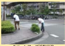
クリーンアップ活動状況

H24.5.20 川西市主催のクリーンアップ活動に参加し、川西市役所からJR川西池田駅までの沿道の清掃活動を行いました。地域の皆様と共に清掃することができ、充実した活動となりました。