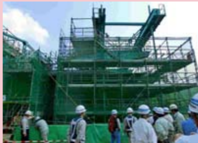
宝塚市西谷自治会連合会現場見学会状況

H24.5.10 宝塚市西谷自治会連合会の方々を対象に建設中の新名神高速道路の現場見学会を実施しました。当日は天候にも恵まれ、約20名の方に参加頂き、橋脚高と張出架設長では日本有数の規模を誇る「川下川橋」や宝塚市域に建設している宝塚SAについて、現地状況を確認して頂きました。今後とも地域の皆さまとは、しっかりとコミュニケーションを図りながら、また、極力ご迷惑をかけないよう留意しながら工事を進めていきます。