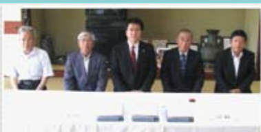
設計協議確認書 調印式（生野地区自治会館）

H24.5.28 神戸市北区道場町の生野自治会において新名神建設事業に関する設計協議確認書を締結しました。生野自治会の皆様には工事へのご理解とご協力を頂き、本当にありがとうございました。関係者一同、安全を第一に工事を進めていきます。