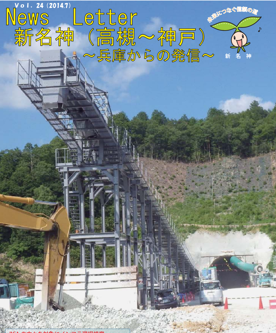
写真：新名神高速道路「初瀬トンネル」工事