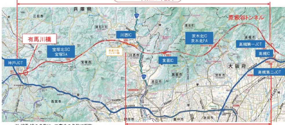
※JCT・ICの名称は、工事中の名称で仮称