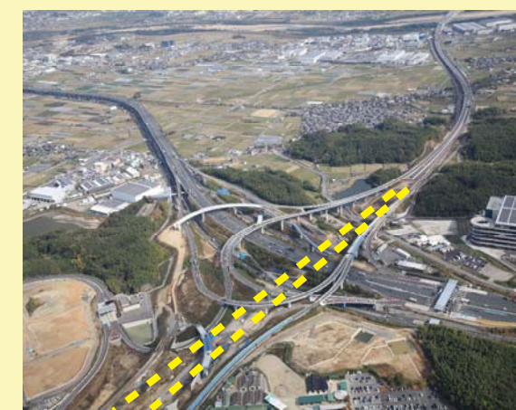
⑥国道1号BPを夜間通行止めし、橋桁を架設しました。