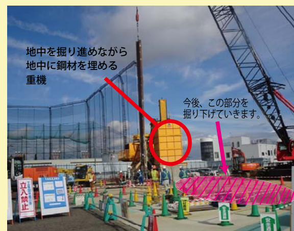
⑤トンネル掘削のための立坑(※2)を施工しています。