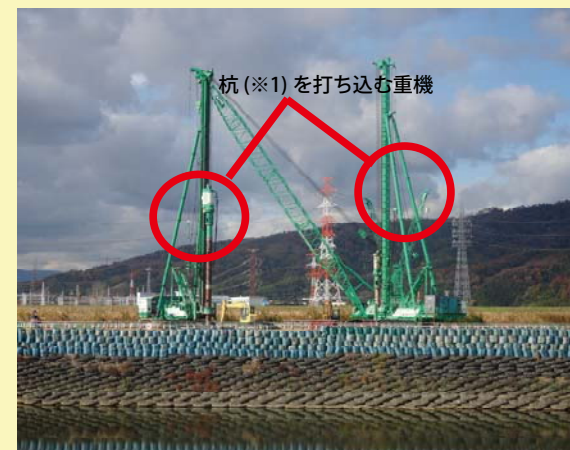
③淀川の河川内で橋脚の基礎となる部分の施工を行っています。