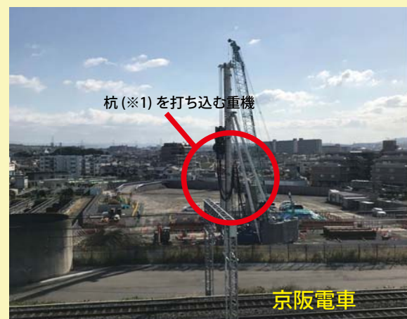
④京阪電車沿線で橋脚の基礎となる部分の施工を行っています。