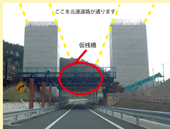
①高槻 JCT で 橋桁架設を行うために工事車両通行用仮橋 および作業構台を設置しました。