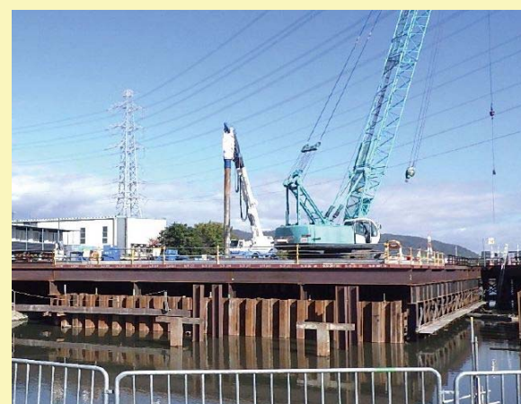
②内ヶ池周辺で橋脚の基礎となる部分の施工を行っています。