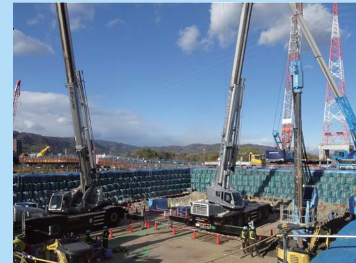
④ 橋脚を支える土台部分である杭の施工を行っています。