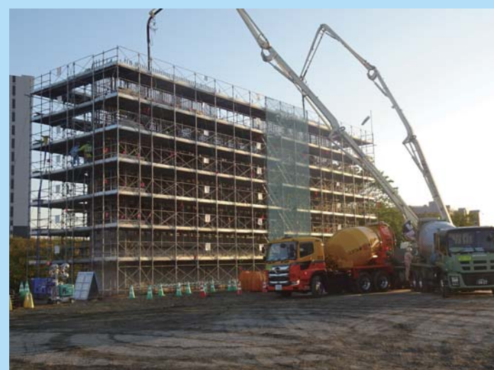
⑤ 橋脚下部工のコンクリート打設を行っています。