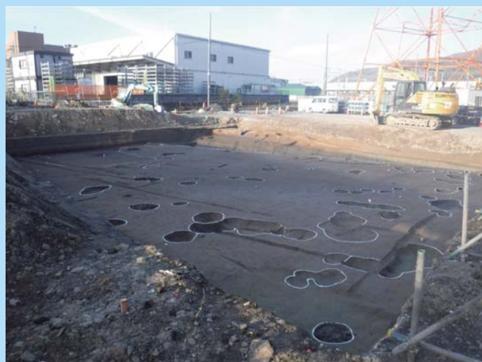
② 工事着手前に埋蔵文化財発掘調査を実施しています。