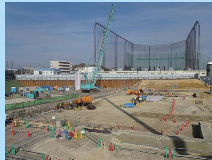
⑦ トンネル入り口の発進立坑施工のために地面を掘り下げています。