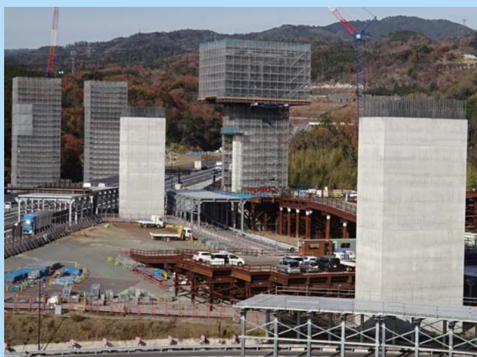
① 橋梁下部工の施工を進めています。