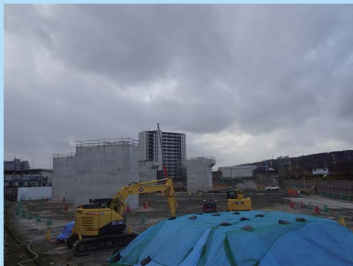
⑥ 橋脚下部工の施工を進めています。