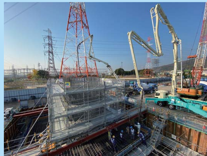
③ 橋脚下部工のコンクリート打設を行っています。