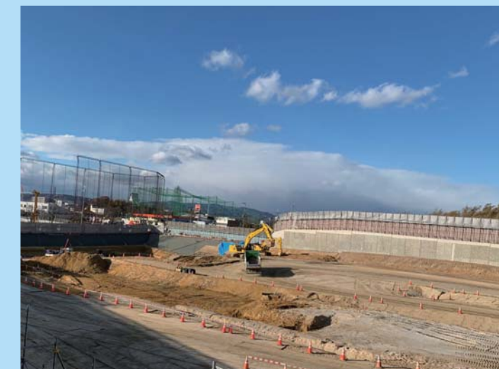
⑧ 八幡市域で地面の掘削を進めています。