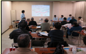
説明会の様子 梶原地区

平成27年1月、枚方市域に引き続き高槻市域において設計の説明会を開始いたしました。また、農地等の水利用者などの関係者と協議を行いながらこれまで実施した測量・土質等の調査結果を反映した道路構造等についての説明と御質問への回答を行っています。