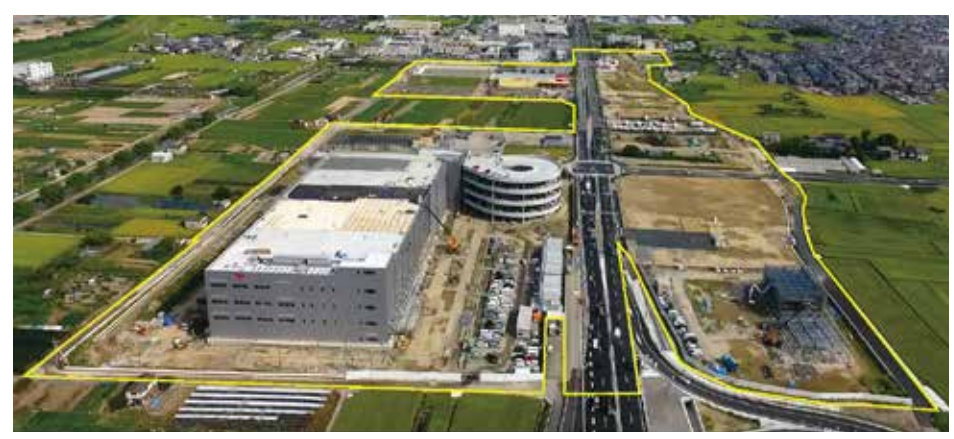
城陽IC北側を南より望む

新名神城陽JCT・ICの開通とあわせて、城陽市の土地区画整理事業による新市街地整備が進められています。城陽市によると、造成工事の現況として、全12区画(13社)のうち6区画(7社)が引き渡し済みとなっており、残り6区画についても年度内に引き渡し予定となっています。8月には城陽市中心部と城陽ICや新市街地を結ぶ新たな都市計画道路塚本深谷線も開通し、ますますアクセスも良好になりました。城陽ICの北側に建設中の日本郵便の大型拠点(京都郵便局)は、来年2月の開局に向けて建物の工事が進んでいます。今後も物流拠点や工場、商業施設が続々と完成していきます。企業進出により、全体で約1,700人の雇用者を見込んでおり、7月及び9月に城陽市などが実施した就職を希望される方への企業説明会も延べ300人を超える来場があったそうで、今後も注目が集まりそうです。