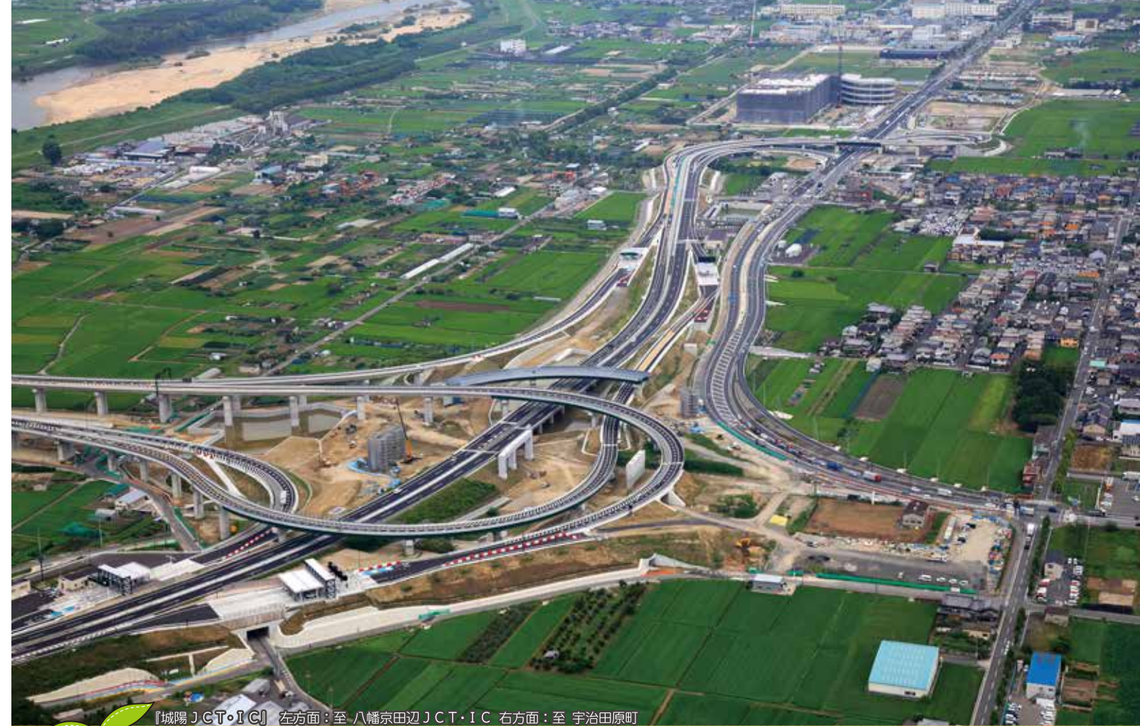
【城陽JCT・IC】左方面:至八幡京田辺JCT・IC 右方面:至宇治田原町