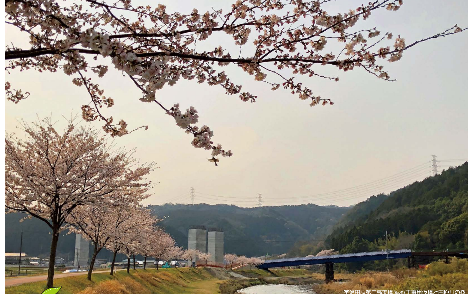
宇治田原第二高架橋(仮称)工所用仮橋と田原川の桜