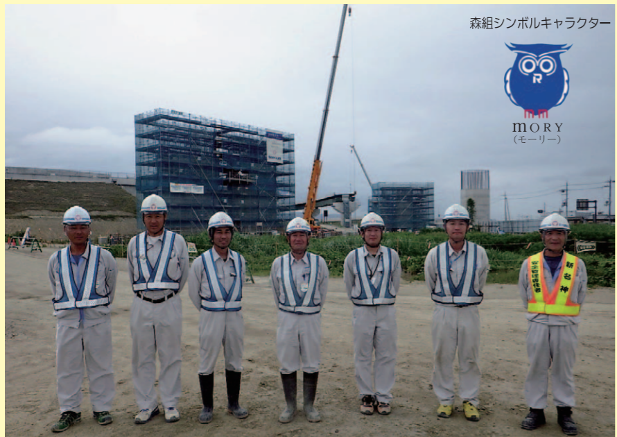
森組シンボルキャラクター

生活道路際の工事となる為、日々気の抜けない施工が続きますが、無事故で工事完成を目指し、スタッフ・協力会社一同、頑張っ て参りますので、引き続きご協力の程、宜しくお願い致します。