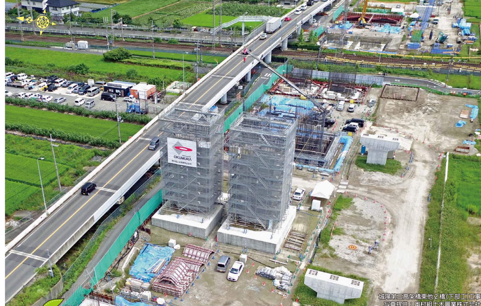
城陽第三高架橋東他2橋(下部工)工事