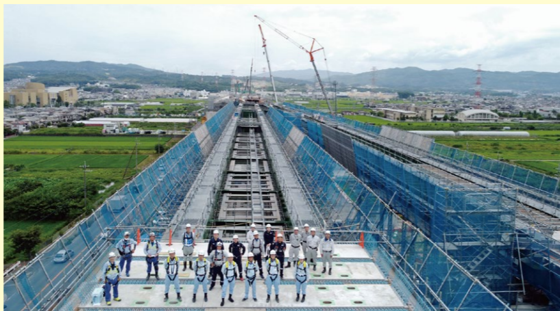
三井住友建設鉄構エンジニアリング(株) 日本ファブテック(株) と新名神京都事務所スタッフ 2021.7.26