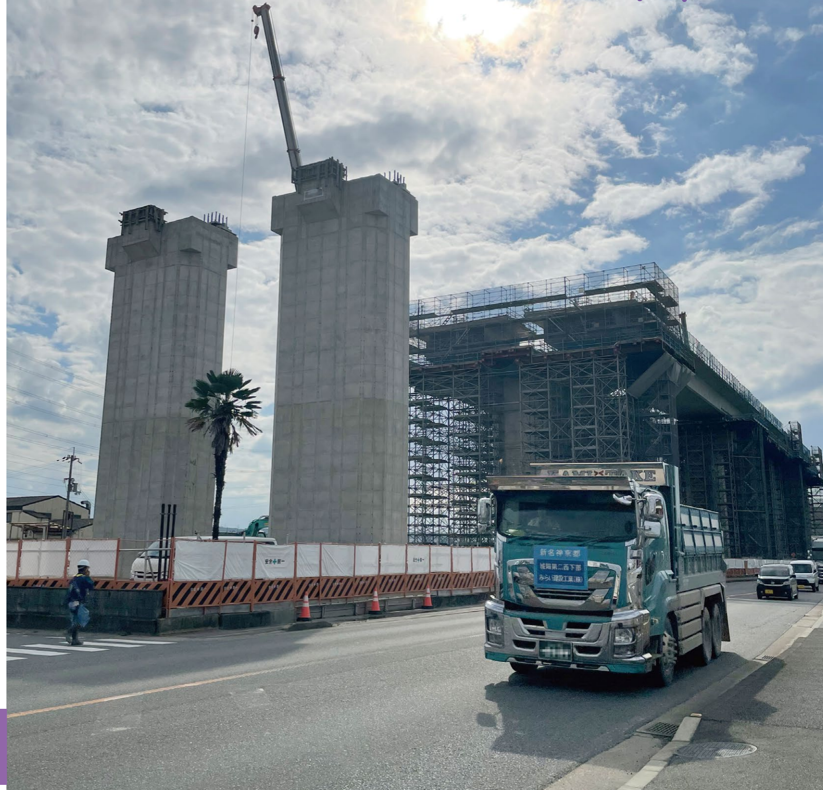
城陽第二高架橋西 下部工工事 <P 17 橋脚>