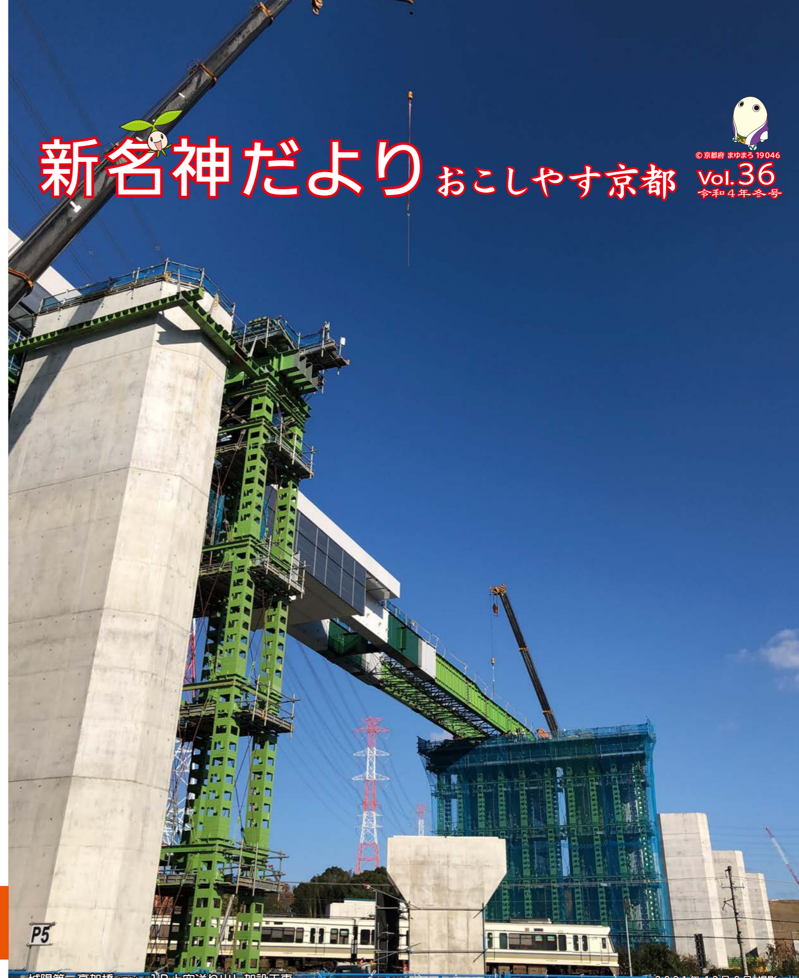
城陽第一高架橋(仮称) JR上空送り出し架設工事