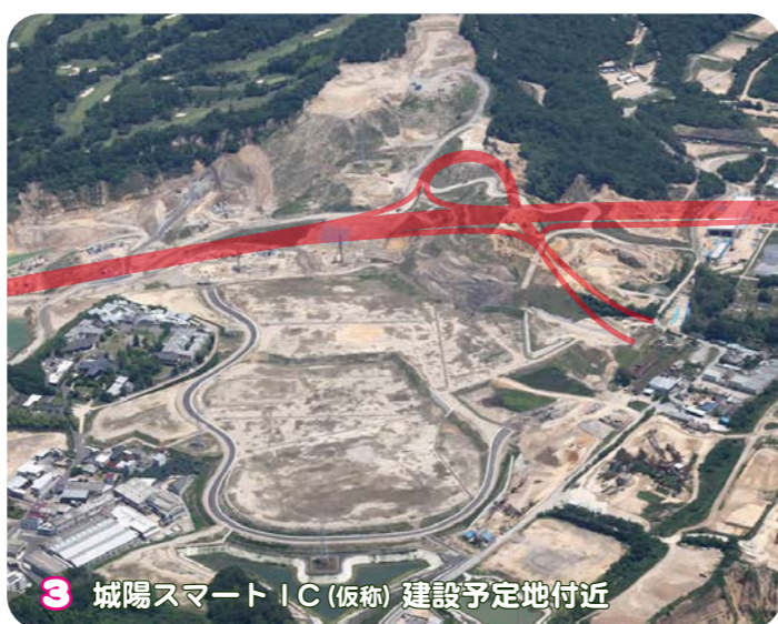
3 城陽スマートIC (仮称) 建設予定地付近