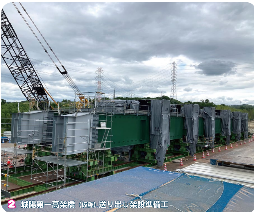
2 城陽第一高架橋 (仮称) 送り出し架設準備工