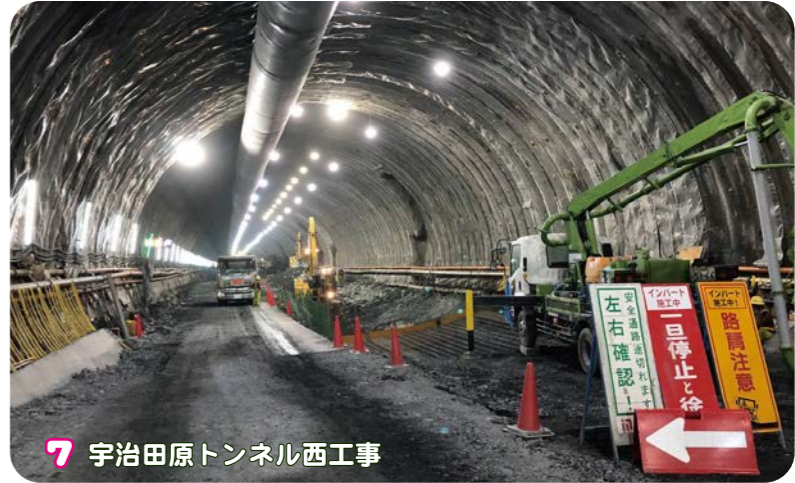
7 宇治田原トンネル西工事