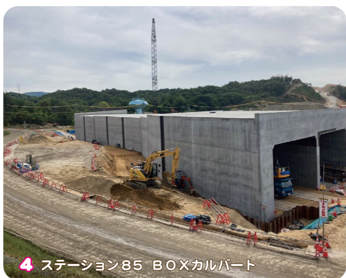
4 ステーション85 BOXカルバート