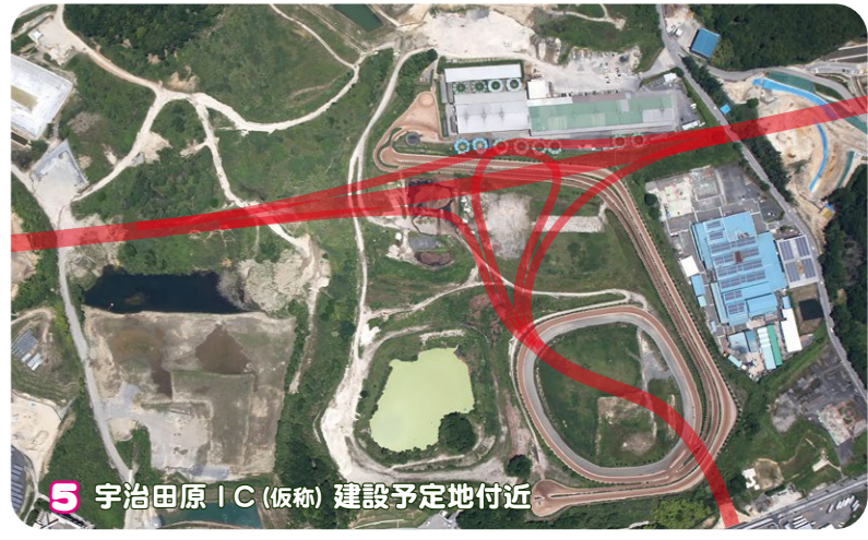
5 宇治田原IC (仮称) 建設予定地付近