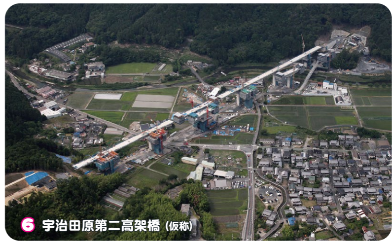
6 宇治田原第二高架橋 (仮称)