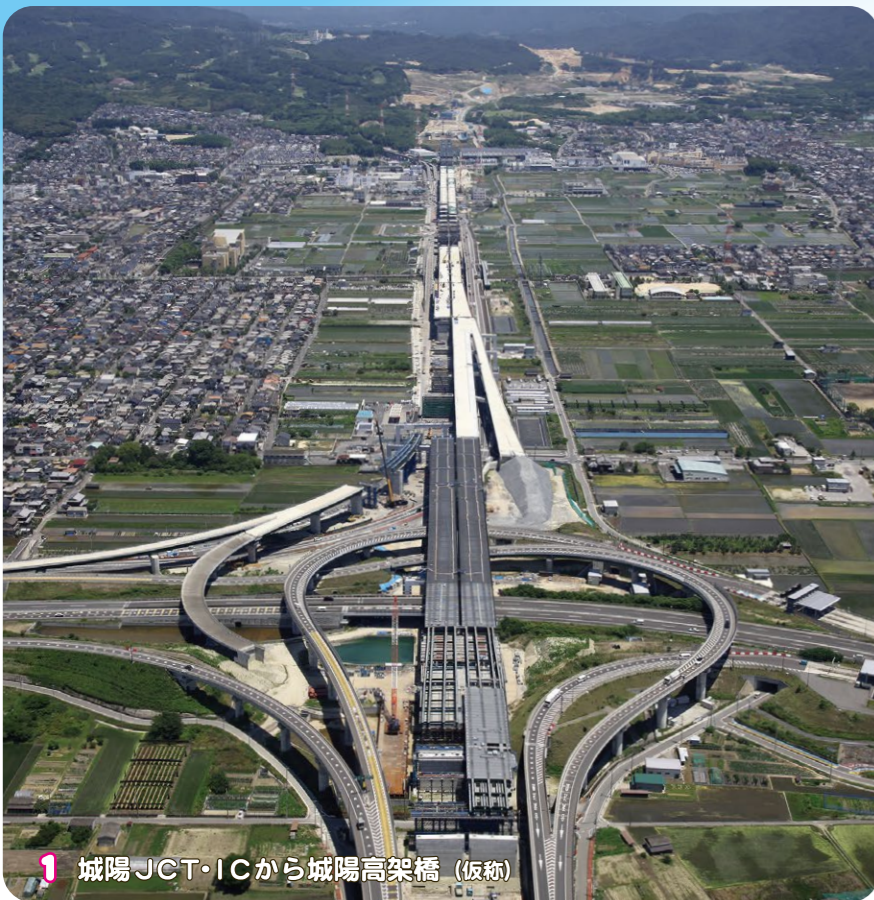
1 城陽JCT・ICから城陽高架橋 (仮称)