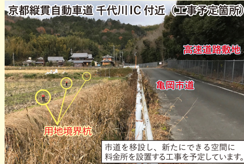
市道を移設し、新たにできる空間に料金所を設置する工事を予定しています。

京都縦貫自動車道では、新たに必要となる用地の契約が完了しました。現在、土工や建築工事のための設計や工事の準備を進めております。