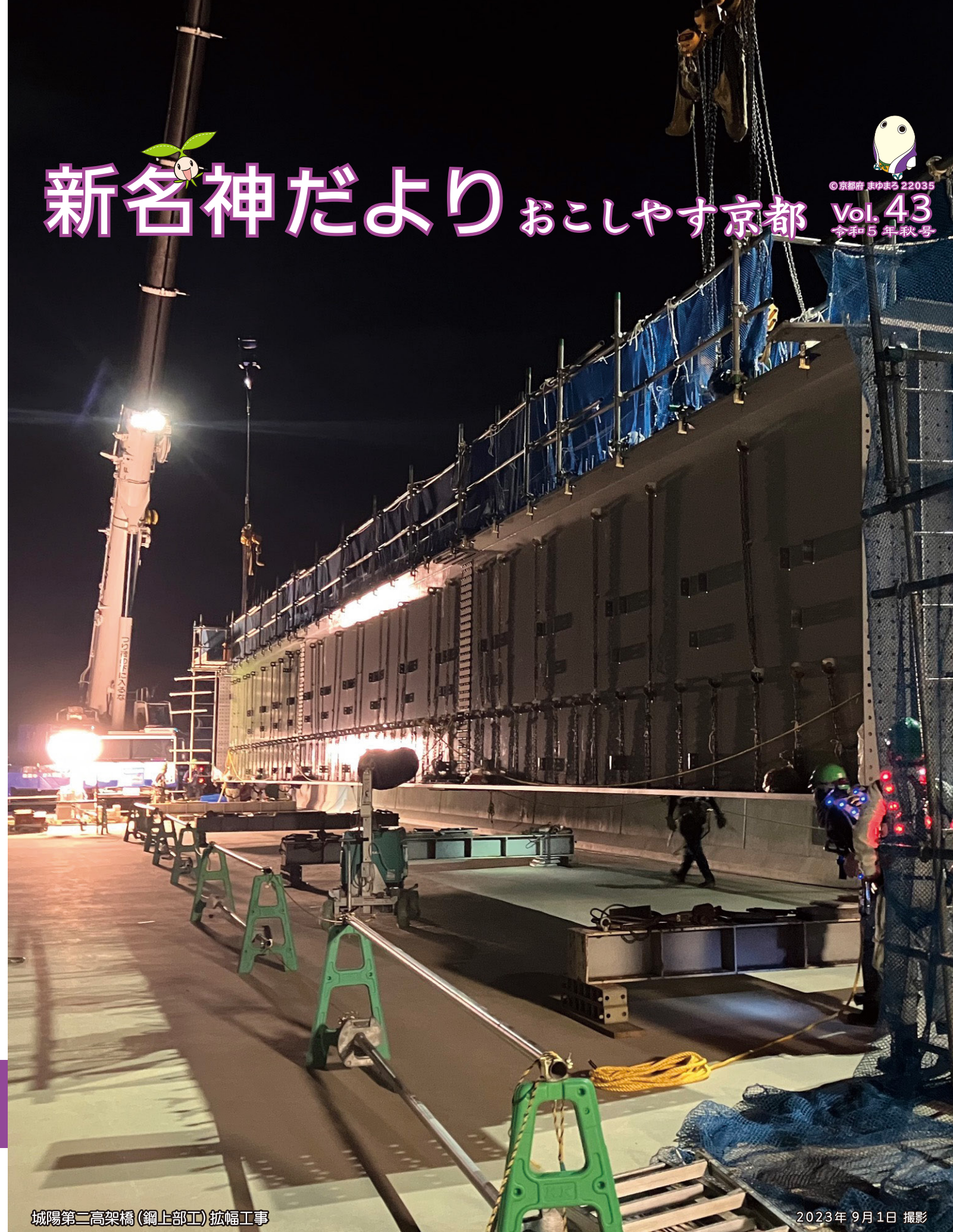
城陽第二高架橋(鋼上部工)拡幅工事