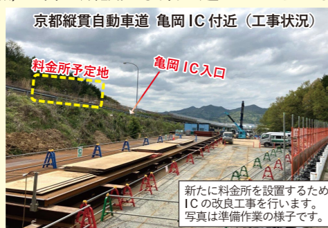
京都縦貫自動車道 亀岡 IC 付近 (工事状況)

京都縦貫自動車道では、2件の土工工事と5件の施設工事を契約締結しました。現在、工事の本格的な現地着手に向けて準備を進めております。