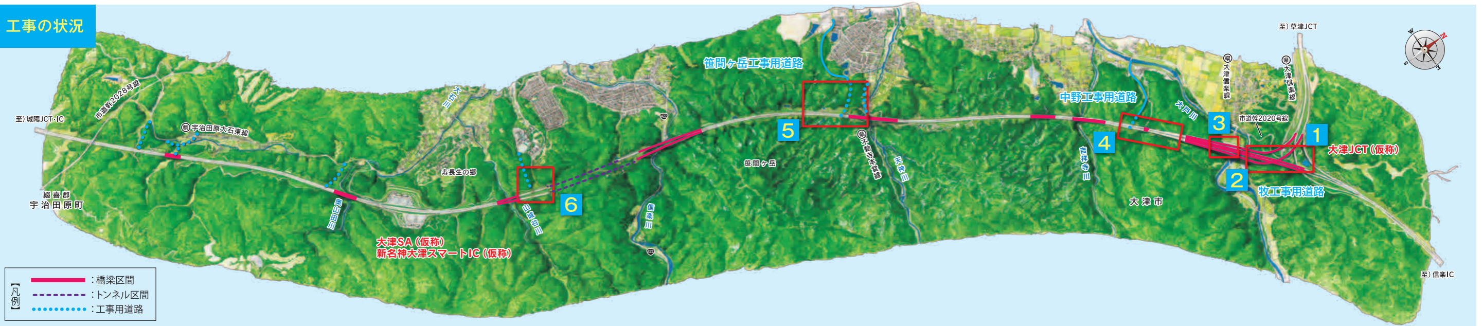
※この図は、航空写真・図面等により作成したイメージです。完成と異なることもあります。