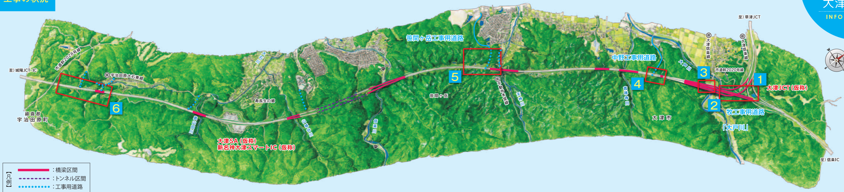
※この図は、航空写真・図面等により作成したイメージです。完成と異なることもあります。