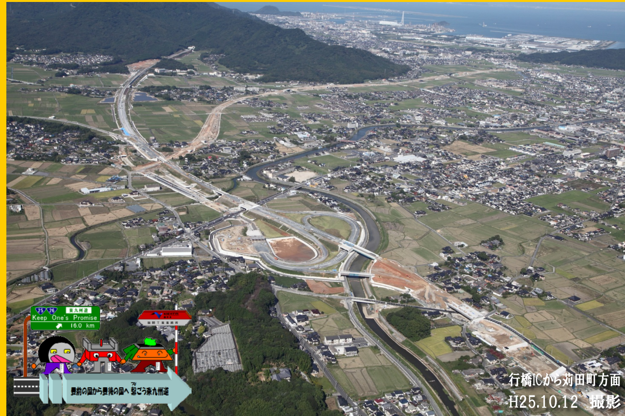
行橋ICから苅田町方面 H25.10.12 撮影