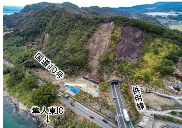
③野久美田トンネル東坑口近