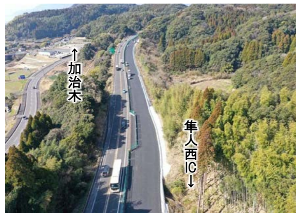
①加治木～隼人西 土工部