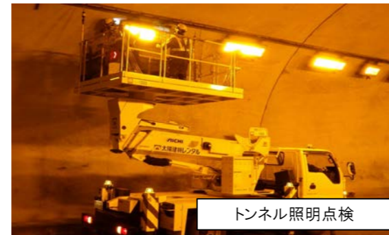
トンネル照明点検