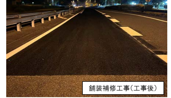
舗装補修工事(工事後)