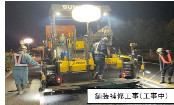
舗装補修工事(工事中)