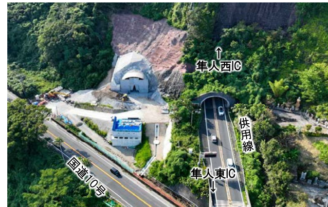
②野久美田トンネル東坑口付近