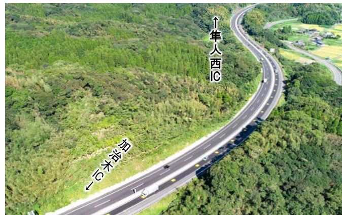
①隼人西～加治木 土工部