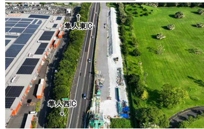
④隼人東～隼人西 土工部