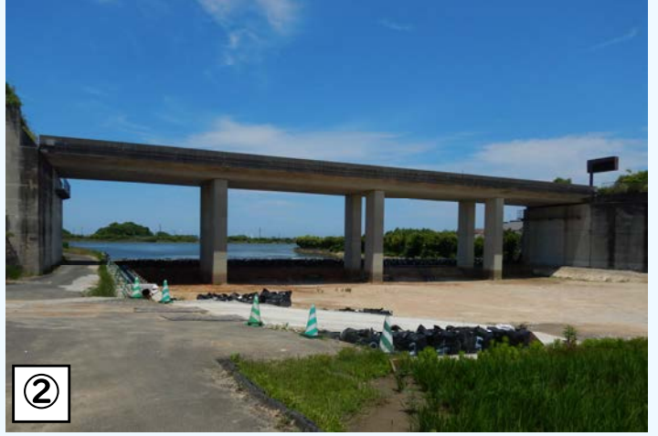
② ○双子池の締め切り工事 橋梁の橋脚などを新たに新設するため、双子池の締め切りを行っています。