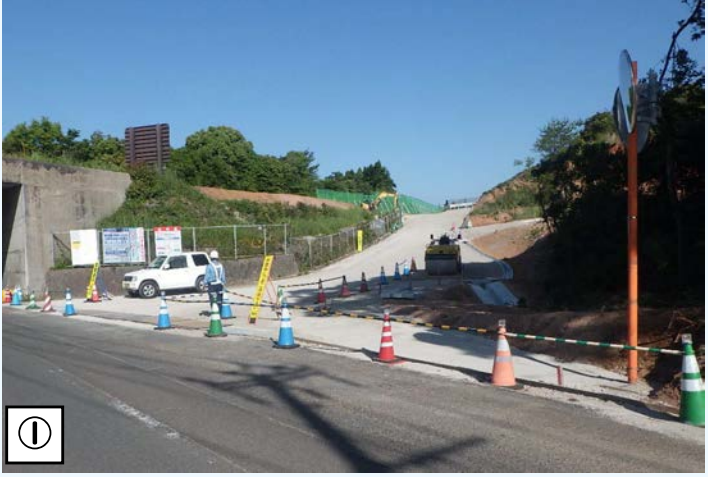
① ○本線への進入道路設置工事 ダンプカーなどの大型車両が進入できるように、町道の拡幅工事を行っています。