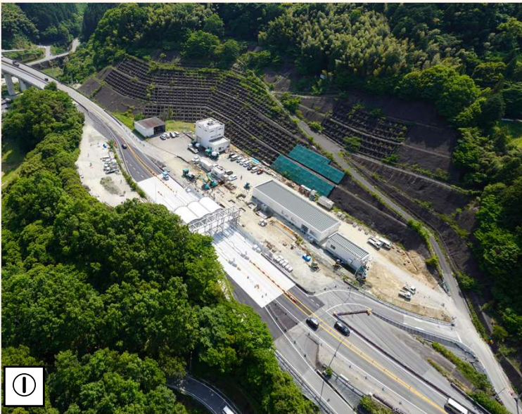
① ○篠栗本線料金所 舗装やETC設備等、料金所付近は工事内容が多くありますが、車線運用を変更しながら、通行止め規制を行うことなく施工しています。本事業の中で最も様変わりする箇所です。