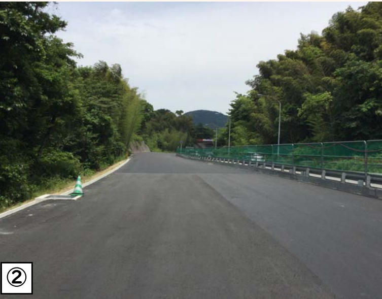
② ○土工部 土工部では現在、基層の舗装作業を行っています。(↑写真は基層舗装済み) 基層とは、最上部層である表層の下にある舗装のことです。表層からの荷重を分散して下の層へ伝える役割があります。