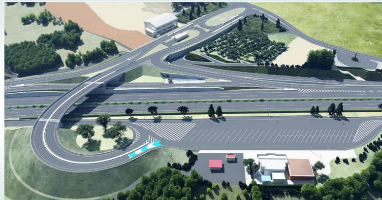
※先行工事は荒川河川部（上流側）の水路トンネル工事となります。