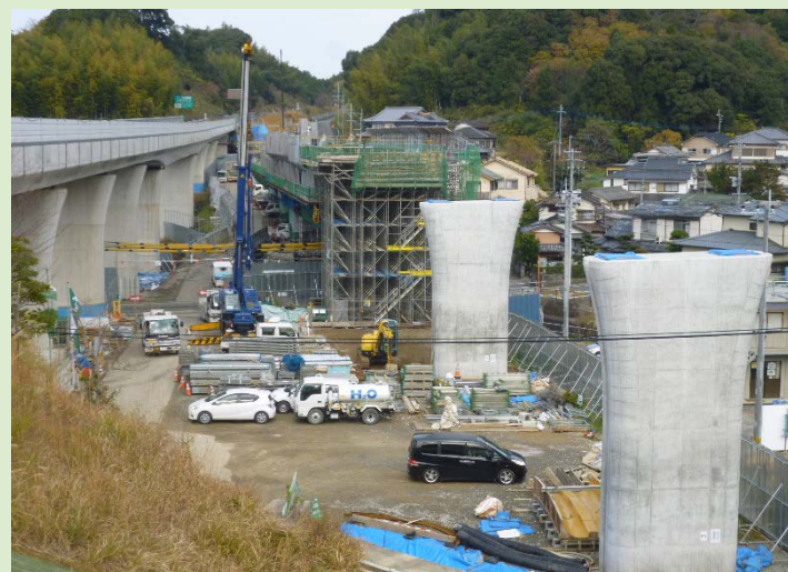
つうつがわ 通都川橋の施工状況(中里地区)