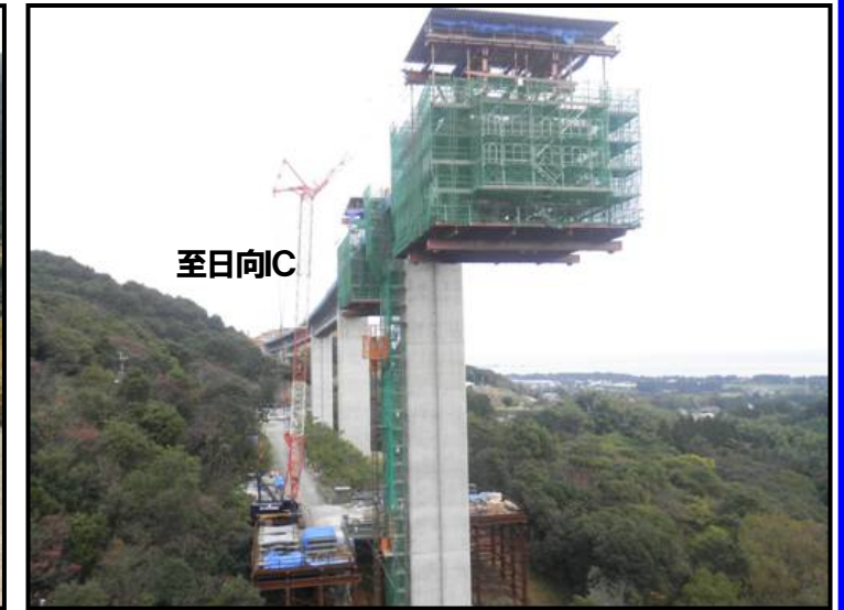
⑧都農町内野々地区土工