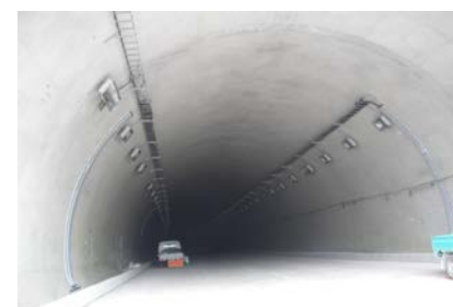
平岩第一トンネル施工状況