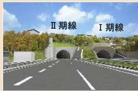
〈西坑口完成イメージ〉