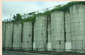
〈斜面对策工完成イメージ〉