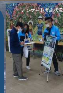
アンケート実施状況