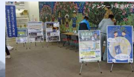
アンケート実施状況