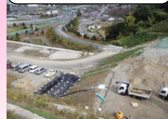
苅田北九州空港IC部

約1.4kmを施工いたします光国トンネル工事です。 平成22年8月24日に現場着手いたしました。