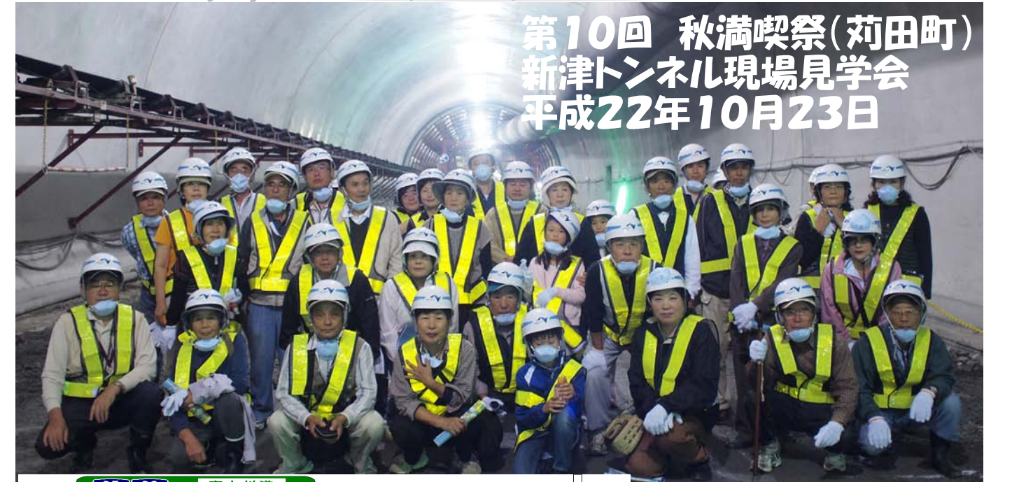
第10回 秋満喫祭(苅田町) 新津トンネル現場見学会 平成22年10月23日