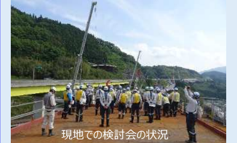
現地での検討会の状況

平成28年の第1回開催から今回で5回目となる地すべり検討会を5/31～6/1に開催しました。伊予地区4車線化(6.3km)のうち、複数の地すべり区域を通過する南側約2km区間において、これまでの地すべり対策の実施報告を行い、今後の対策工事に関して、学識経験者や社内外の有識者の皆様より貴重なご意見を戴きました。