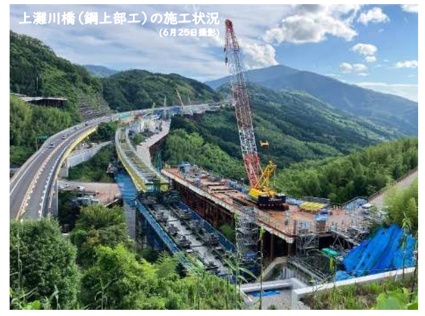
上灘川橋(鋼上部工)の施工状況 (6月29日撮影)