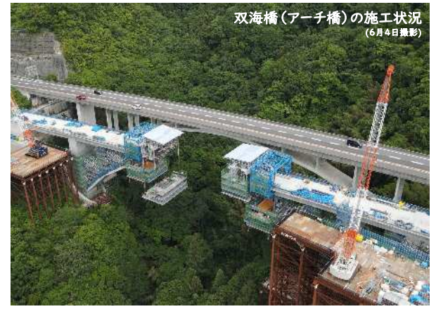
双海橋(アーチ橋)の施工状況 (6月4日撮影)

大洲地区では、工食用道路の造成を行っています。供用路線付近での作業は、通行車両に影響が出ないよう、夜間通行止め期間中に作業を行っております。今後も引き続き通行止め工事へのご理解・ご協力をよろしくお願いいたします。