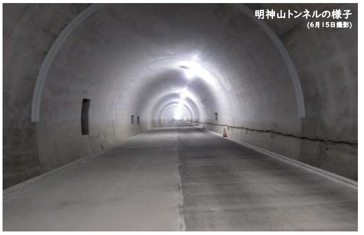
明神山トンネルの様子 (6月15日撮影)