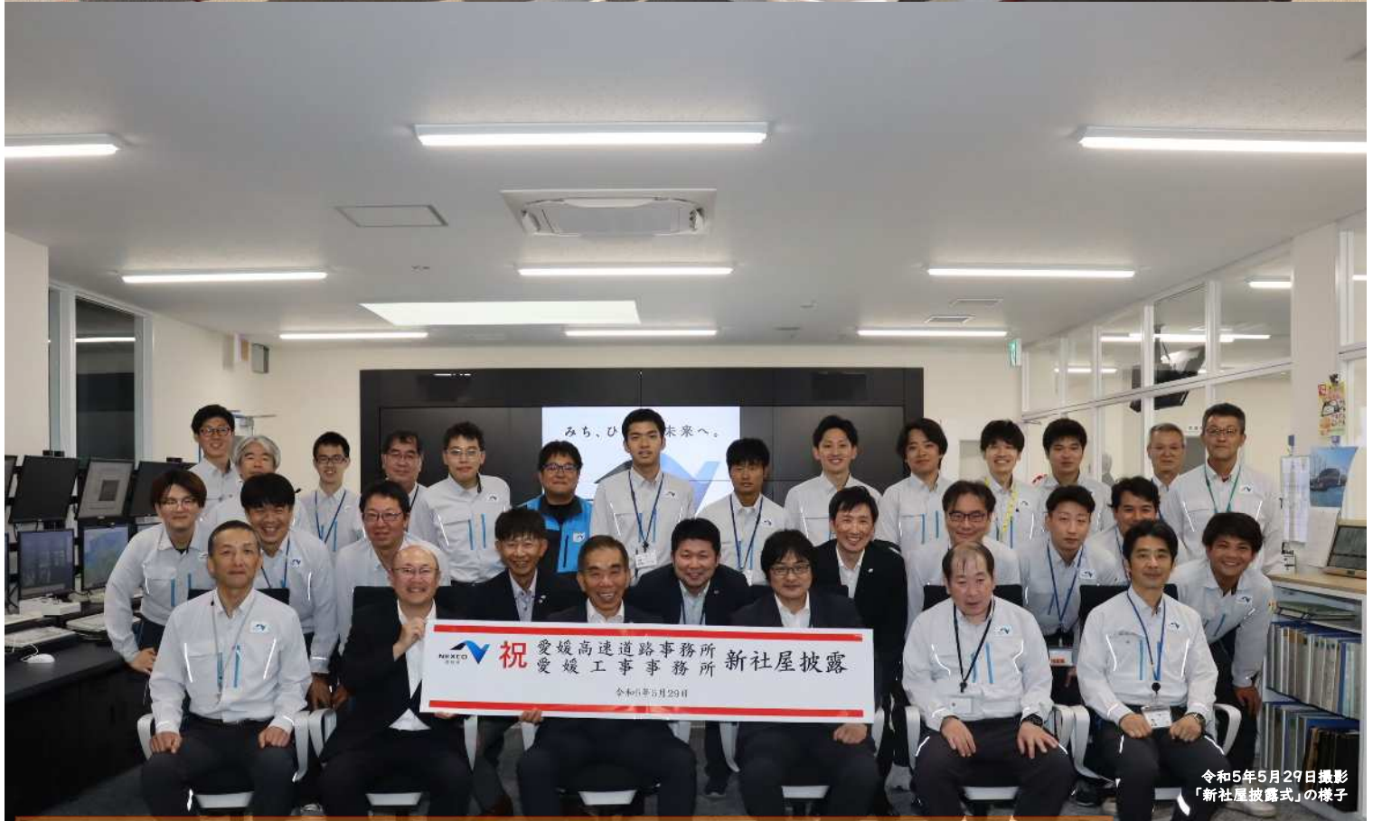
令和5年5月29日撮影 「新社屋披露式」の様子