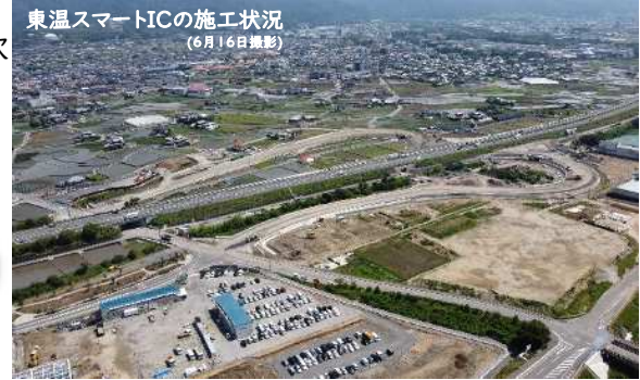
東温スマートICの施工状況 (6月16日撮影)