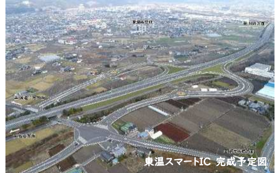
東温スマートIC 完成予定図