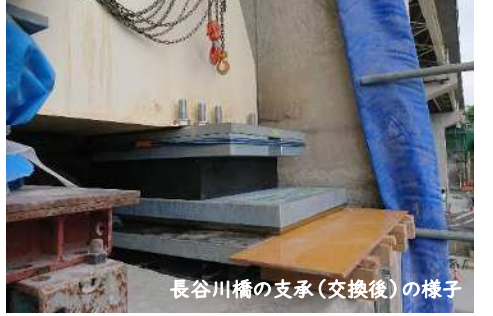
長谷川橋の支承(交換後)の様子