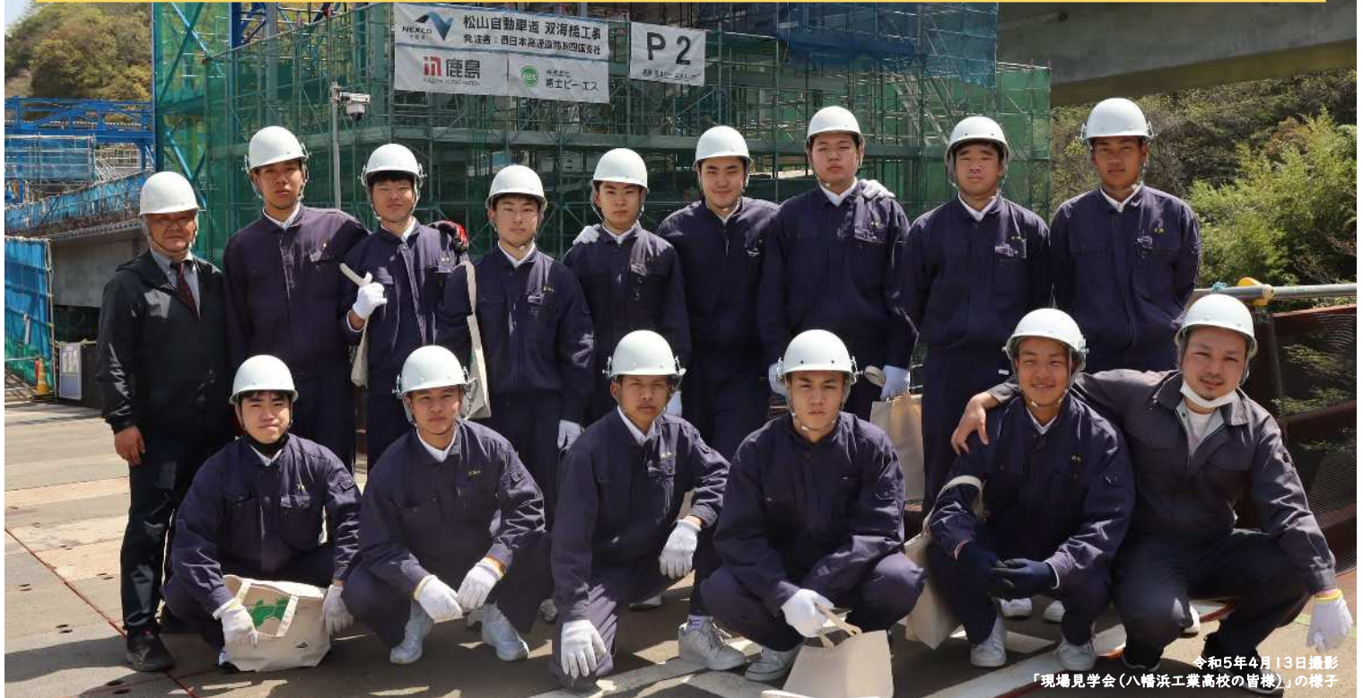
令和5年4月13日撮影 「現場見学会(八幡浜工業高校の首座)」の様子