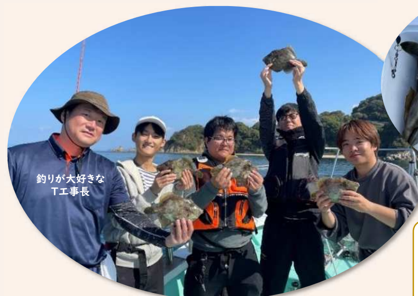
釣りが大好きなT工事長

Bさん) まだまだ若いと思っていましたが、イメージと体の動きが一致せず年には勝てないですね。エンジ四国さん余裕の優勝おめでとうございます!(50代男性)