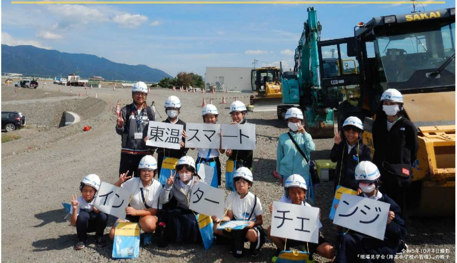
令和5年10月4日撮影 「現場見学会(拝志小学校の皆様)」の様子