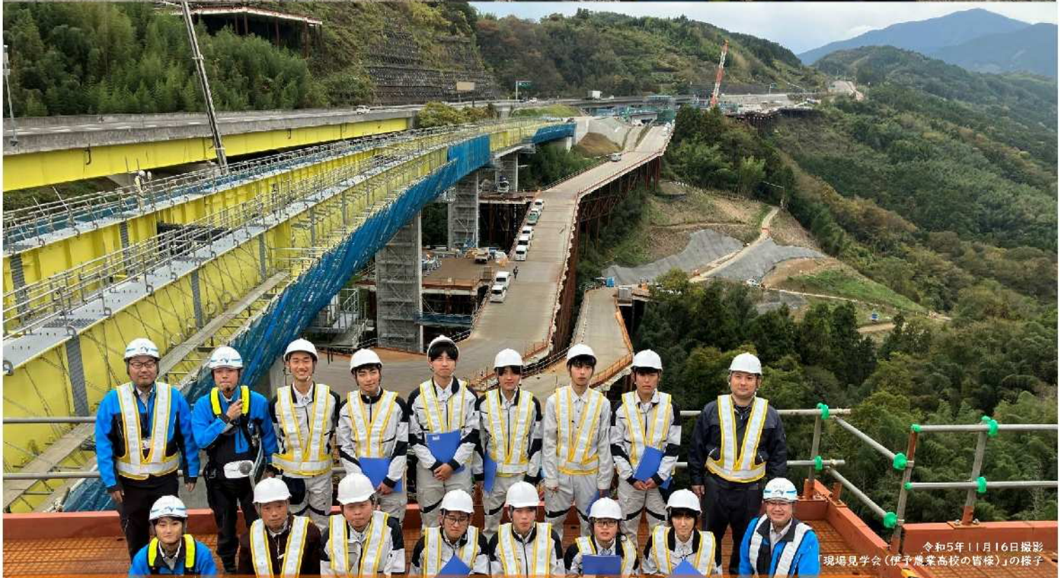
令和5年11月16日撮影 「現場見学会(伊予農業高校の皆様)」の様子