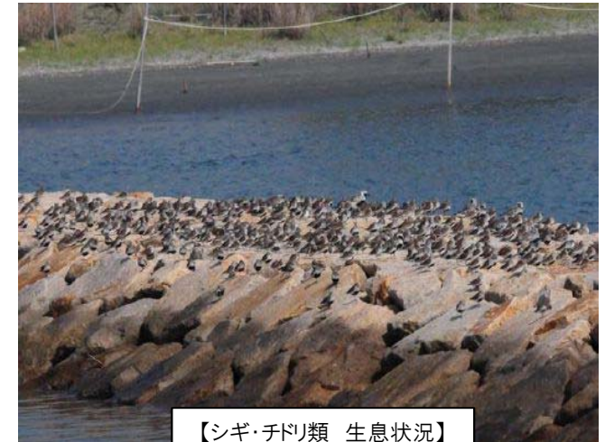
【シギ・チドリ類 生息状況】