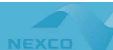
西日本高速道路株式会社 事業評価監視委員会 再評価 要点審議