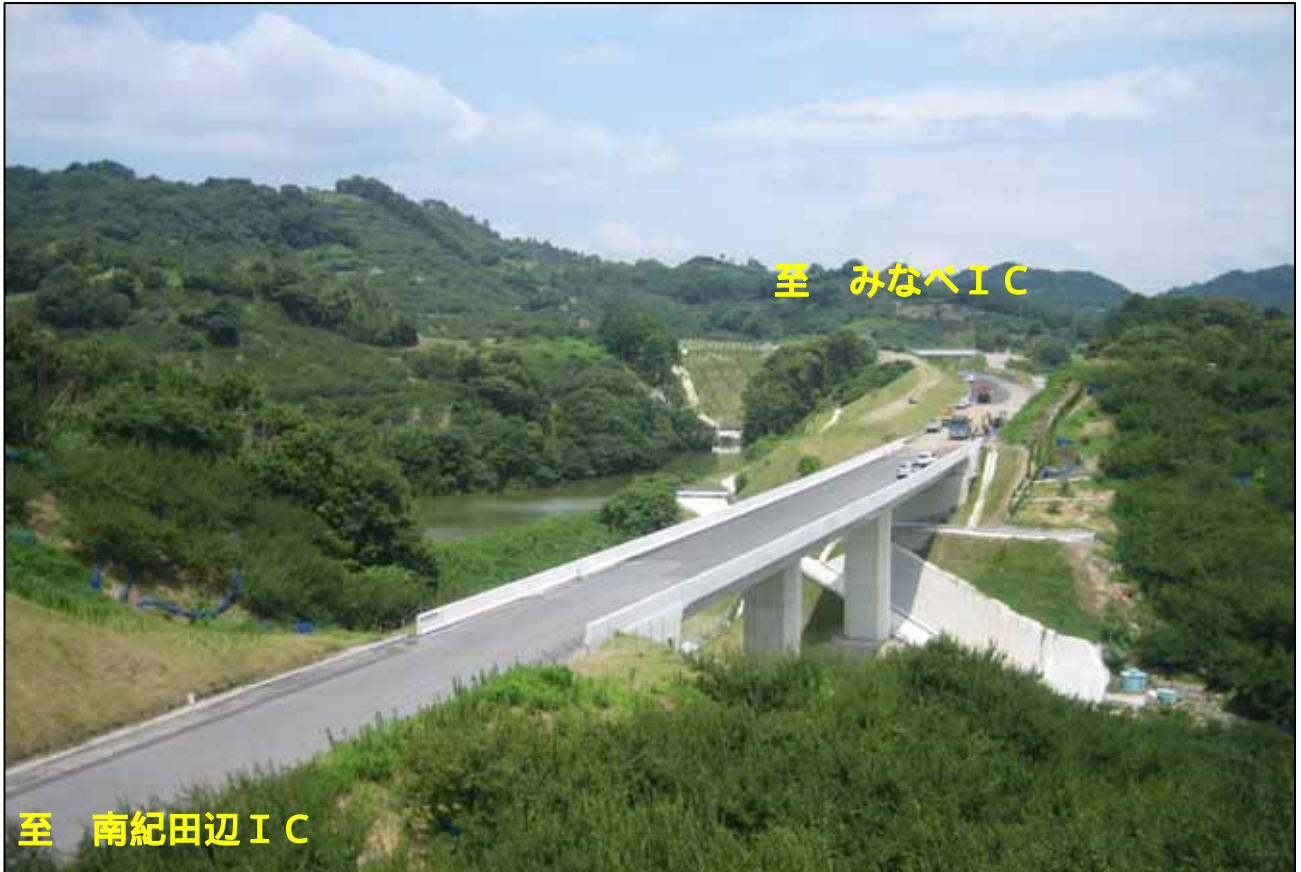
【 南紀田辺IC料金所付近 平成19年7月18日撮影】