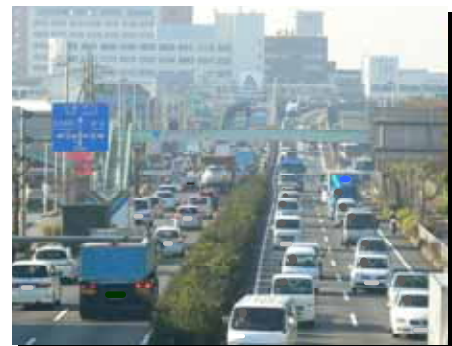
寝屋川市太間東町付近

北河内地域: 枚方市, 交野市, 寝屋川市, 門真市, 四条畷市, 守口市, 大東市