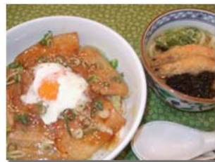
長崎道 金立SA(下り線) 肥前さくらポークの蒲焼丼