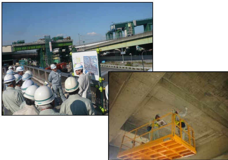
【現場講習会や技術交流】