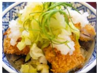
長崎道 川登SA(上り線) : 若楠ポークの塩カツ丼