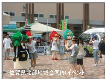
佐賀県北部地域合同PRイベント