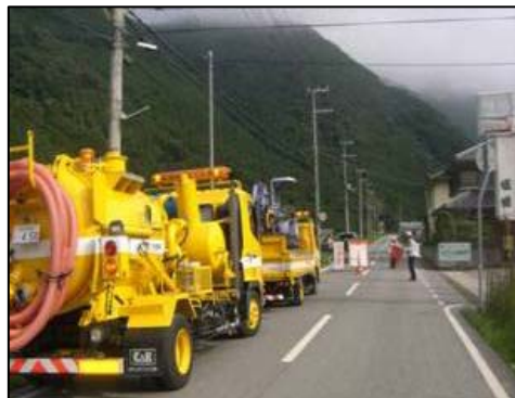
【災害時の復旧協力】