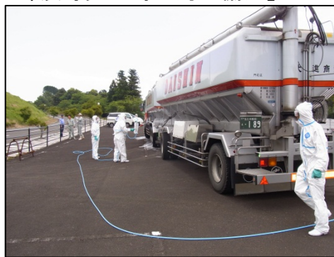
【口蹄疫等発生時の対応協力】