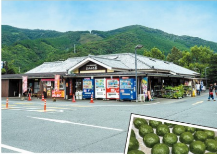
北方よつちみろ屋 TEL0982-48-0808 延岡市北方町早日渡E175-1