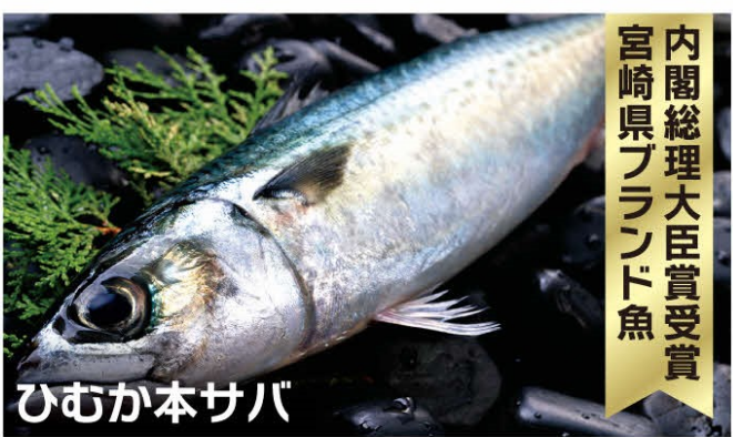
内閣総理大臣賞受賞 宮崎県ブランド魚