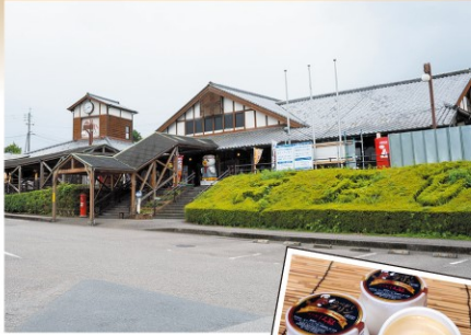
北川はゆま TEL0982-24-6006 延岡市北川町長井5751-1