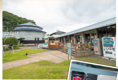
北浦 TEL0982-45-3811 延岡市北浦町古江3337-1