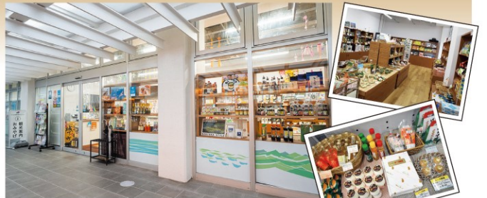
のべおか観光物産ステーション