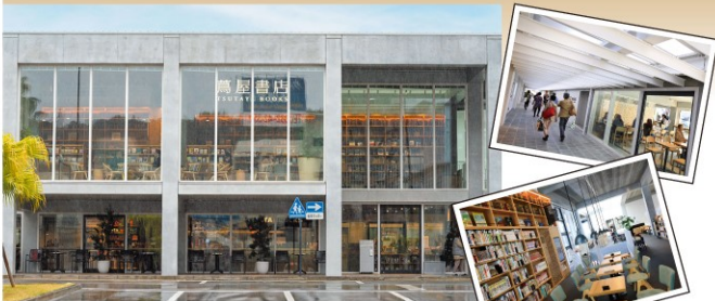
延岡市駅前複合施設エンクロス