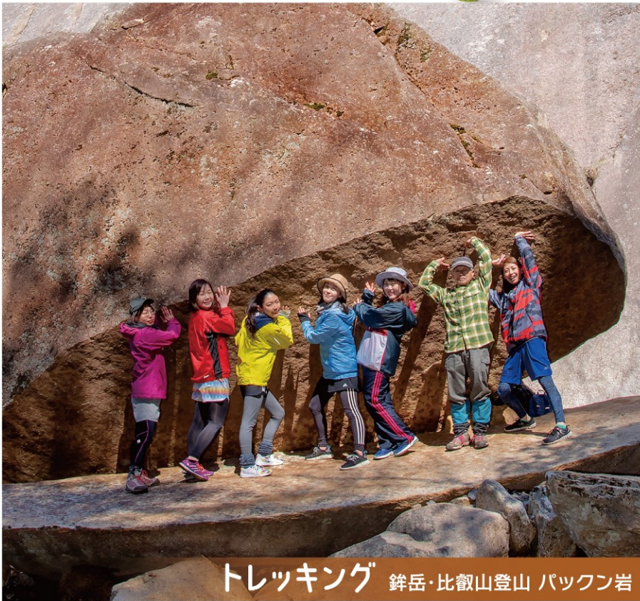
トレッキング 銚岳・比叡山登山 パックン岩