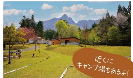
近くにキャンプ場もあるよ!