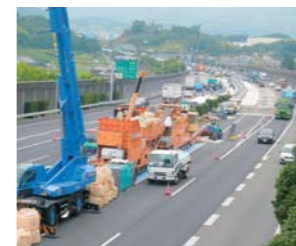
中国自動車道での集中工事規制

経年劣化や交通荷重による橋梁劣化が進んでおり、路面には床版劣化に伴うポットホール(路面損傷)が頻発しています。そこで、補修に伴う緊急工事規制の回数を減らすため、ポットホール発生件数の多い橋梁から順に集中工事規制による補修工事を実施しています。2007年度から床版上面増厚工事(床版防水工含む)や舗装補修工事、中分防護柵老朽化更新工事などを行っており、2010年度は、中国自動車道 西宮山口ジャンクション～神戸ジャンクション間の2橋について、約8,300㎡の床版上面増厚工事を行いました。