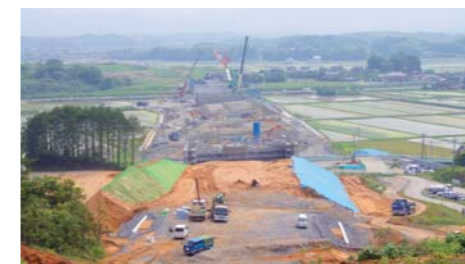
工事が着々と進む盛土区間