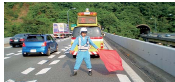
安全を最優先に現場で対応する交通管理隊員

また、2010年7月、大阪、兵庫、京都、滋賀の各県警と連携した「高速道路重大事故根絶プロジェクト」に参加し、渋滞時の重大事故根絶に向けた対策を継続的に議論しています。ETC休日特別割引の実施で、これまであまり高速道路を利用いただいたことがなかったドライバーも増えていきますので、安全確保に向けたより一層の努力が必要だと考えています。