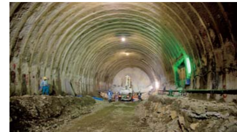
騒音・振動に細心の注意を払いながら掘削を実施

盛土工事は2011年後半から始める予定ですが、その際は10tのダンプカーが市街地の生活道路を走るようになりますので、粉じん対策や交通安全対策に万全を期し、ダンプカーの速度超過や過積載が無いようドライバーへの指導も徹底するよう社員に呼びかけています。