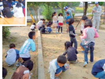
地元小学生と一緒にどんぐり拾い