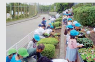
花植えを楽しむ子どもたち

高速道路の沿道地域との共生を図るため、NEXCO西日本ではさまざまな交流イベントを行っています。中国自動車道では、宝塚市立安倉北小学校の児童と一緒に、小学校前ののり面花壇で「花植え会」を毎年2回(6月頃:2年生、12月頃:3年生)実施しています。「花植え会」は2011年で22年目を迎え、約20年前に児童として参加した方も子どもたちが参加するなど、2世代にわたった行事として地域で親しまれています。