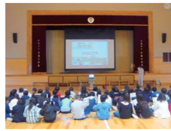
出張学習会で高機能舗装の仕組みを説明

また、福岡工事事務所独自の取り組みとして、地元小学生と一緒に沿道の緑樹帯にどんぐりの木を植える予定です。拾ったどんぐりを苗木になるまで育成し、開通前に植樹します。