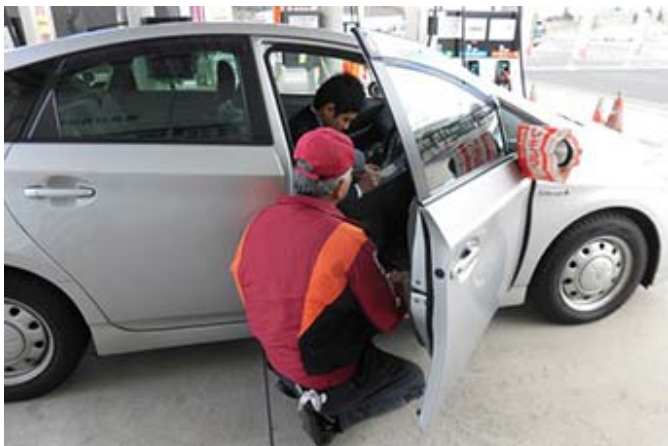
誤給油防止訓練の様子