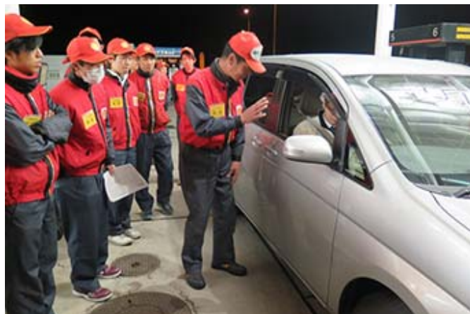
誤給油防止訓練の様子