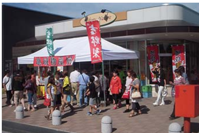
地域物産展の様子 (九州自動車道 宮原SA (上り線))

今後も各テナント会社や地元の商工会と協働しながら継続開催していく予定であり、2016年度は、毎月第2土曜・日曜を基本としつつ、3連休がある月は3連休にシフトして開催することで、より多くのお客さまに地域の魅力を発信していきたいと考えています。