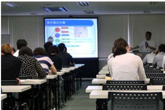
食品衛生講習会の様子