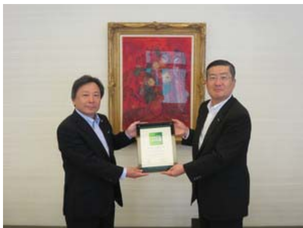
融資実行証授与式の様子

※企業の女性活躍推進の取り組み状況を独自の基準で評価し、現状の取り組み状況や今後の課題、その課題への取り組み事例などを提供する（株）三井住友銀行の融資商品