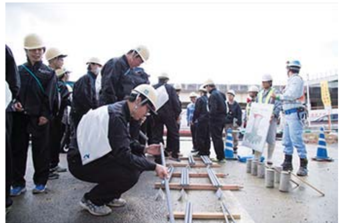
学生向け現場見学会の様子