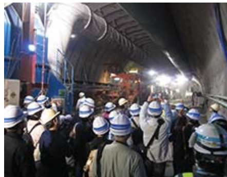
新名神高速道路 現場見学会の様子