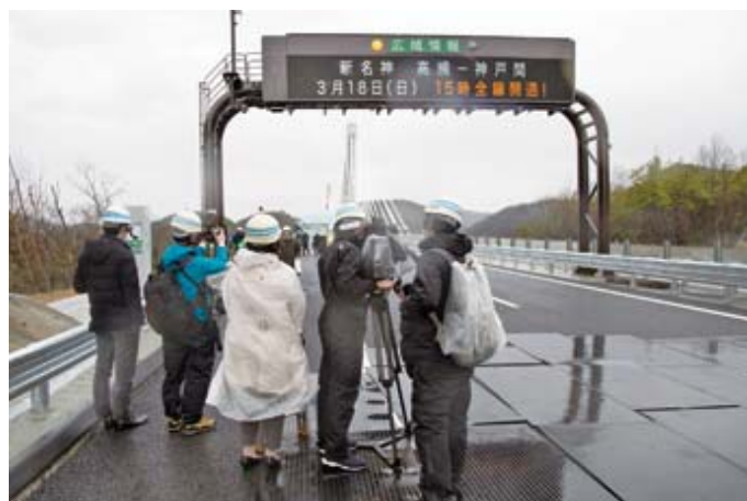
新名神開通前プレスツアー（本線部）