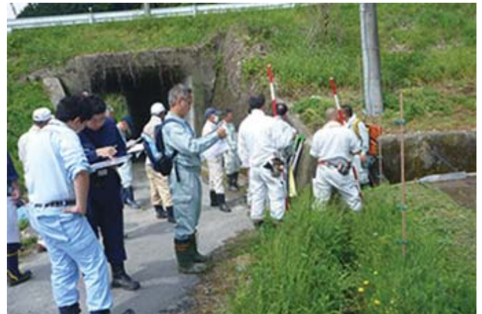
境界立会（新名神京都事務所）