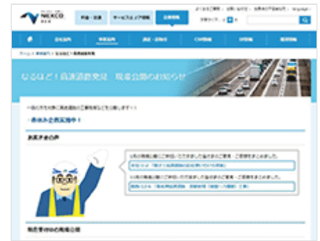
現場見学会の専用受付サイト 「なるほど！高速道路発見」