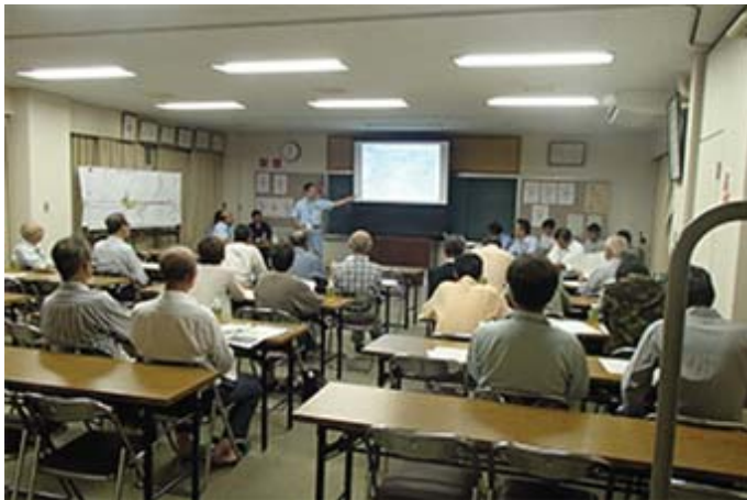
事業説明会（新名神大津事務所）

事業の全体概要はもちろん、環境対策や事業用地の取得など特に関心の高い事項については、必要に応じて現地での立ち会いや説明会を実施し、関係者の十分な納得が得られるまで説明を行っています。