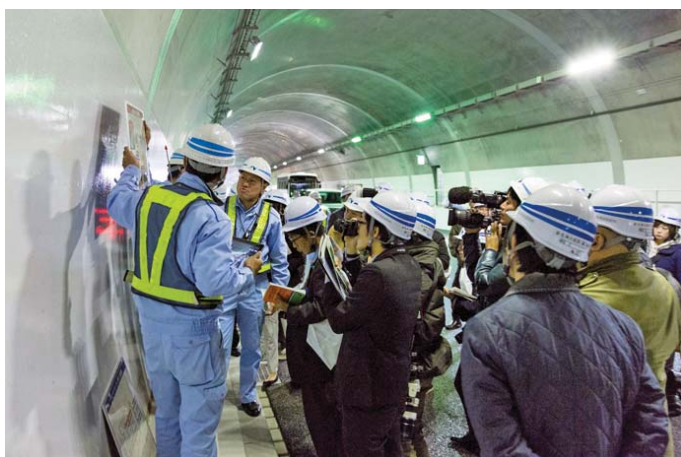
新名神開通前プレスツアー（トンネル）

また、冬季に実施する冬用タイヤ規制時のタイヤチェックを迅速化・効率化する目的で試行導入する『冬用タイヤ自動判別システム』のデモンストレーションをマスコミ向けに公開し、テレビ・新聞等を通じ、高速道路の安全・安心に向けた取り組みを積極的に情報発信しました。