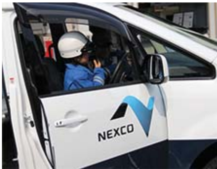
パトロール車両乗車体験の様子

今後も親子で参加していただける夏休み企画などのニーズの高い見学会を開催し、多くのお客さまに当社の安全・安心の取り組みなどを知っていただけるよう、積極的な広報に努めていきます。