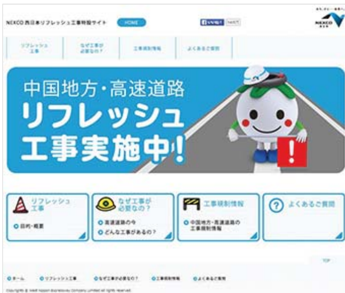
リフレッシュ工事特設サイト

また、WEBサイトでは、渋滞を回避して快適にご利用いただくため、工事規制予測や渋滞予測の情報を掲載するなど、日々、新鮮でお役立ちいただける情報発信に努めています。