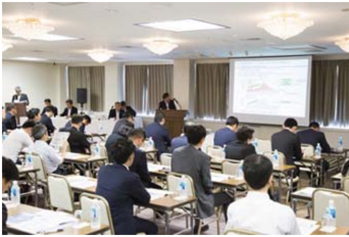
2017年7月21日 事業説明会