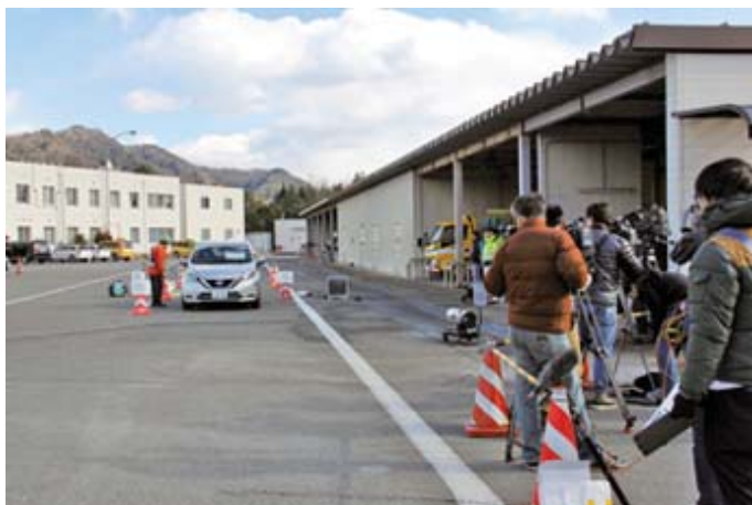
冬用タイヤ自動判別システムデモンストレーション