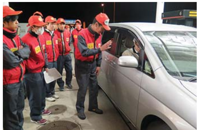
誤給油防止訓練の様子