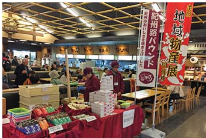
秋の味覚大物産展の様子 (山陽自動車道 吉備SA 下り線)