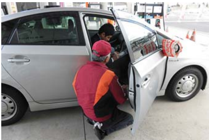
誤給油防止訓練の様子