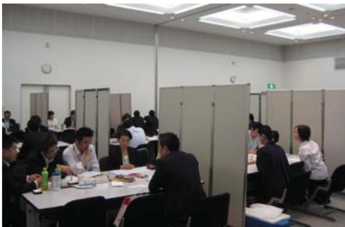
ビジネスマッチングの様子

地域産品の販路拡大や新たな地域の逸品の開拓、地域の食材を活かした食事メニューの開発などを目的に、地域企業とSA・PAのテナント会社による商談会（ビジネスマッチング）を開催しています。2017年7月に(株)西日本シティ銀行・(株)長崎銀行・(株)豊和銀行と連携して実施した『九州ハイウェイ大商談会』では、計140社が参加し、延べ297商談のうち、45商談が成約に至りました。この取り組みにより、地域社会の活性化に貢献してまいります。