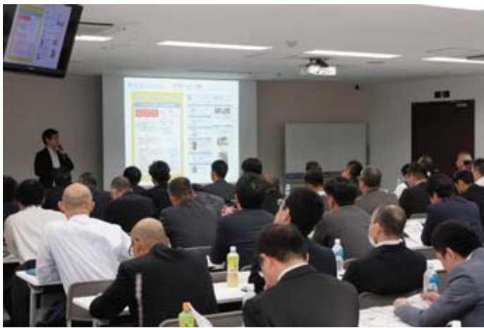
アレルギー講習会の様子