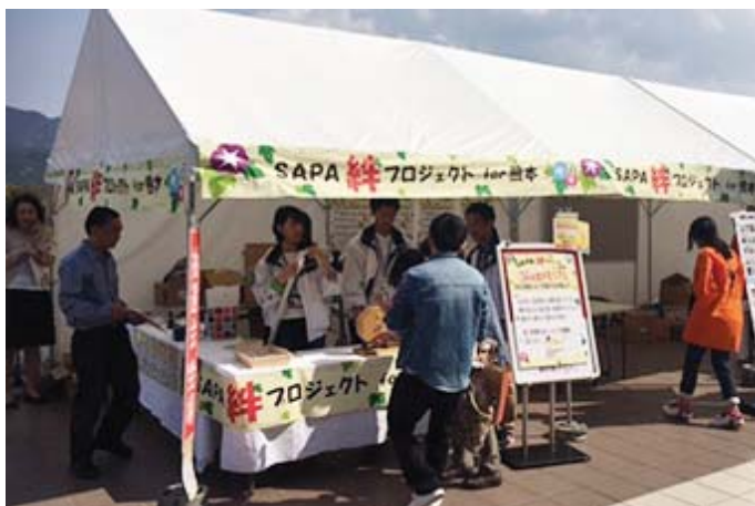
SAPA絆プロジェクトの様子for熊本 (九州自動車道 古賀SA 上り線)

今後も各テナント会社や地元の商工会等と協働しながら継続開催することで、より多くのお客さまに地域の魅力を発信していきます。