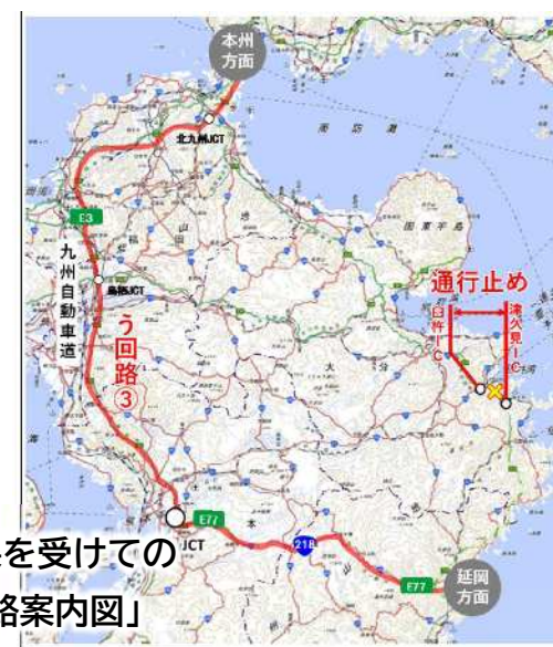
検討会の結果を受けての「広域う回路案内図」